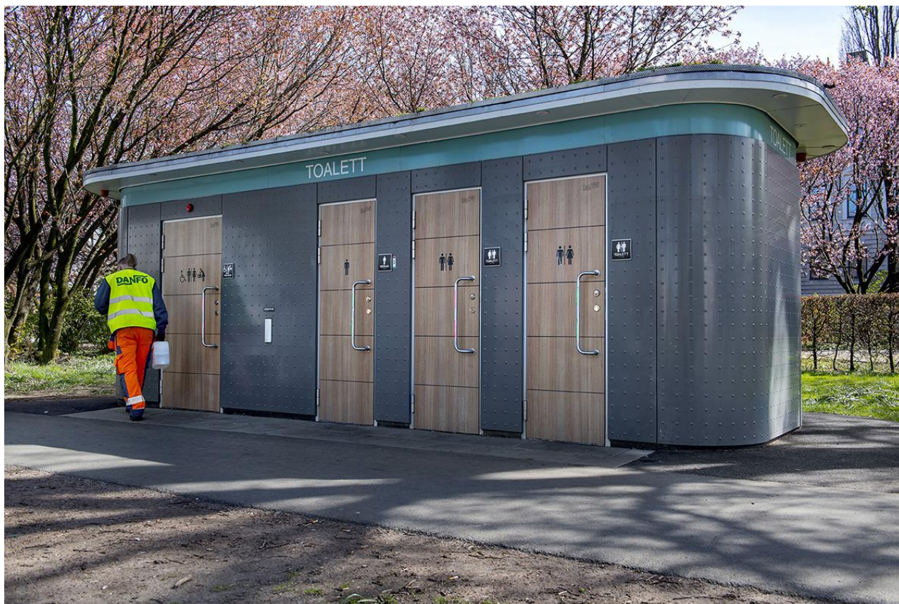
Hyrtoaletten sköter drift och skötsel av Danfos offentliga toaletter i Göteborg.